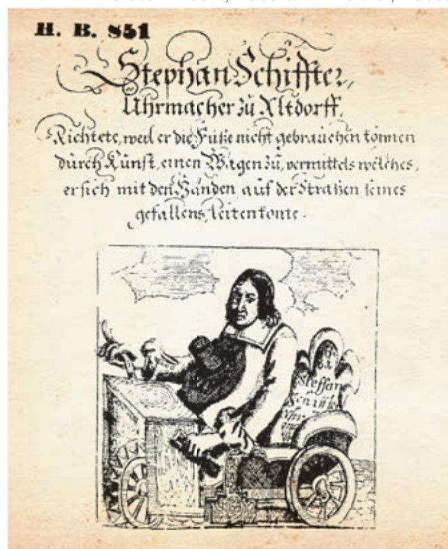
Le véhicule d'invalides de Stephan Schiffter. 1681.

Sources : Nurberg Germanisches National Museum graphische sammlung. Inv. Nr. HB 851 Kapsel 1385. Siehe HB 852 / 1385 et HB 25728 / 1385.