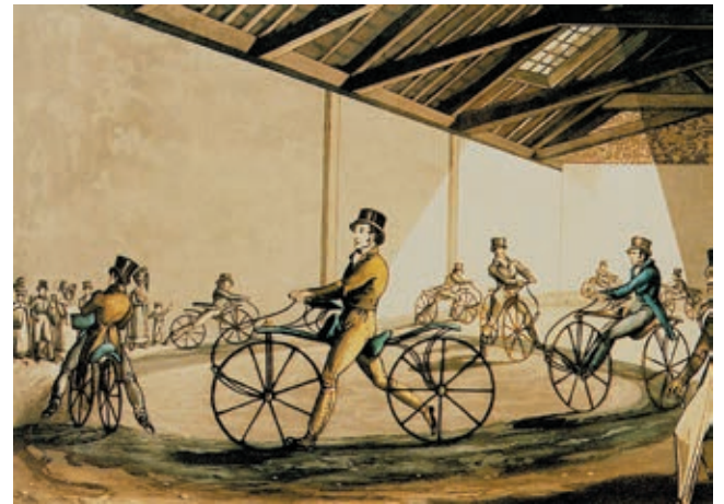
Pré-industrialisation chez Johnson. Ici, son manège. Gravure publiée en 1819.

Pré-industrialisation de quadricycles. Vers 1860. G.B.