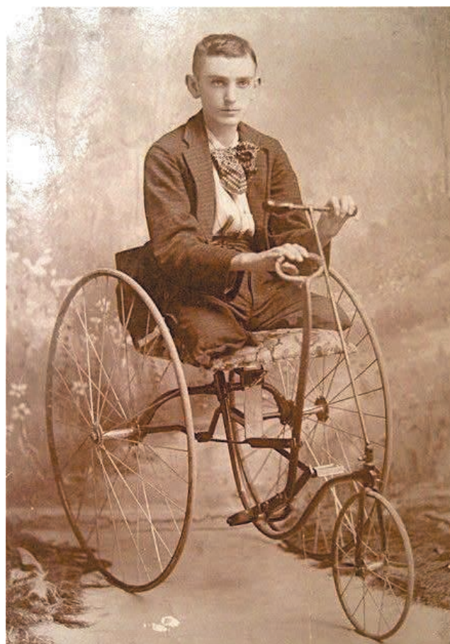
Exemple de véhicule d'infirme. Tricycle adapté à un cul-de-jatte. Photo non datée. Droits réservés.