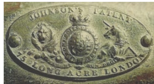
Plaque de marque d'un hobby-horse Johnson.

Source : Brevet anglais pris par Denis Johnson le 22 décembre 1818. N° 4321.